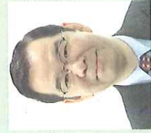
党委員長・前衆院議員 志位和夫