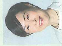
前衆院議員 はたの君枝