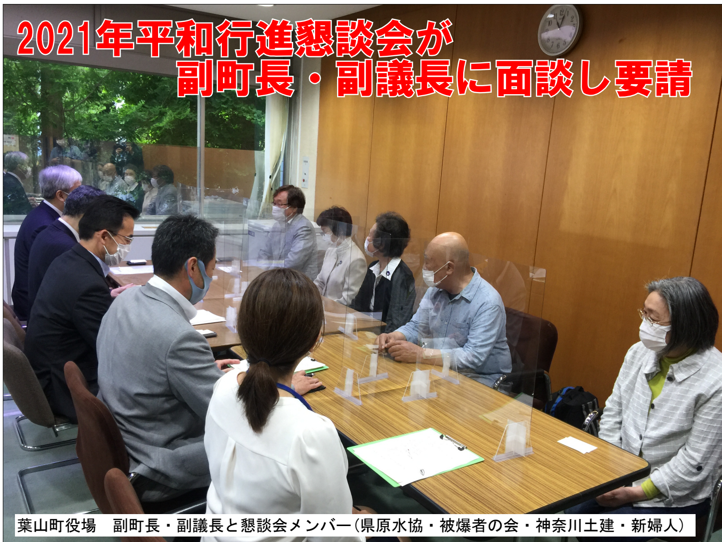
葉山町役場 副町長・副議長と懇談会メンバー(県原水協・被爆者の会・神奈川土建・新婦人)