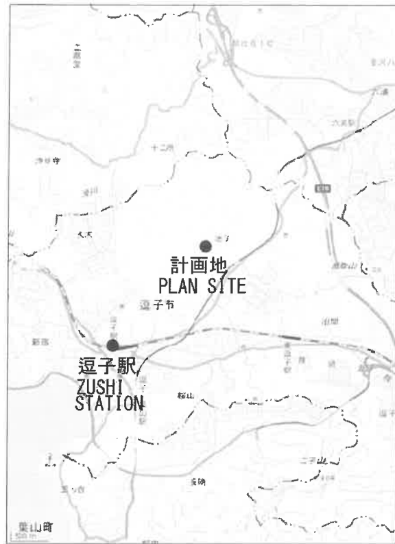
広域地図 (Wide area map)