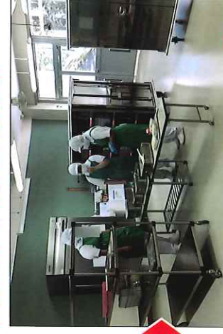
給食を受け取る配膳補助員