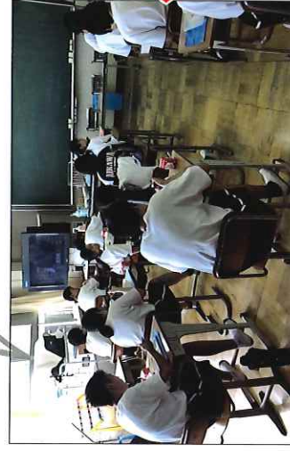
間隔を空けて給食を食べる生徒