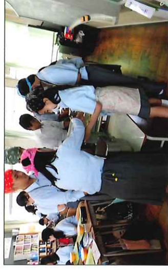
京都府八幡市を視察（2017年7月6日）