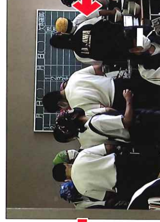
盛り付けする給食当番