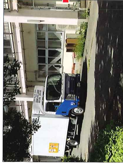
給食を積んだ配送車が到着（愛川中学校）