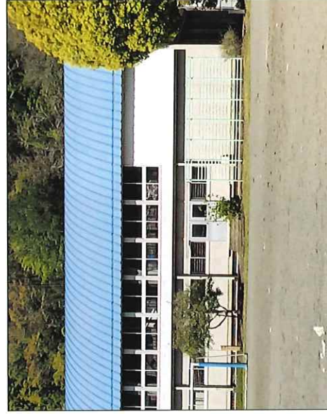
照明器具がLED化された田代小体育館