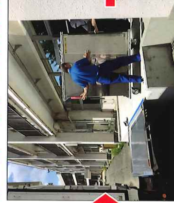
コンテナを配膳室へ搬入