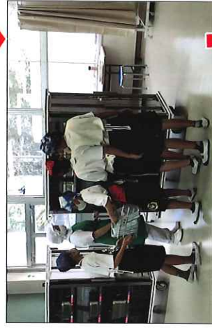
食卓を受け取る生徒