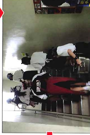
食卓を持って教室に運ぶ生徒