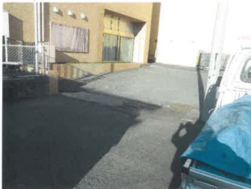
⑧ 現況写真 (2019年2月18日撮影)