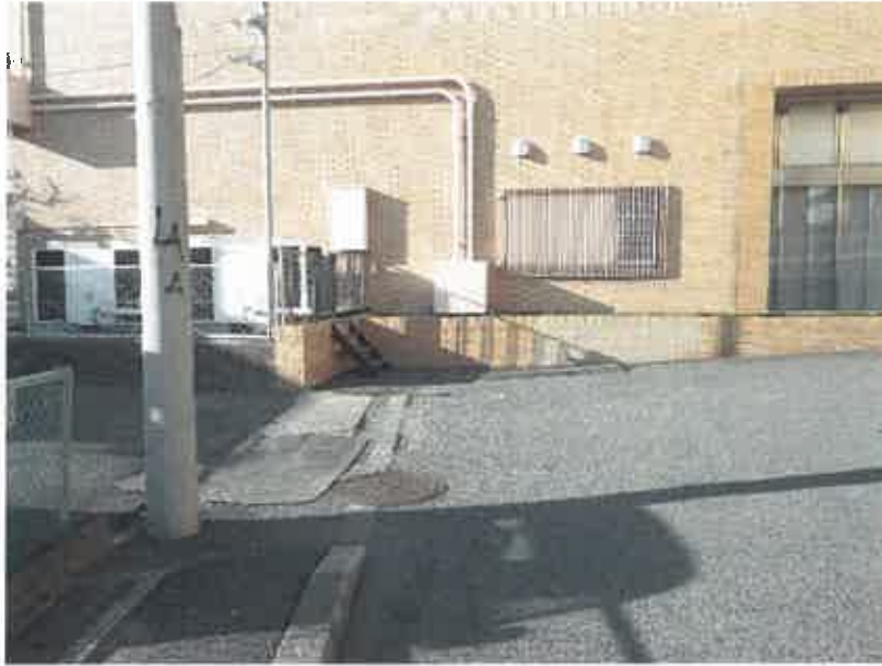
⑤ 現況写真 (2019年2月18日撮影)