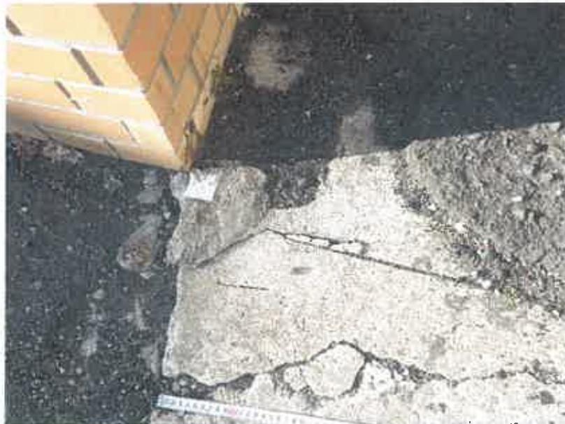
⑥ 現況写真 (2019年2月18日撮影)