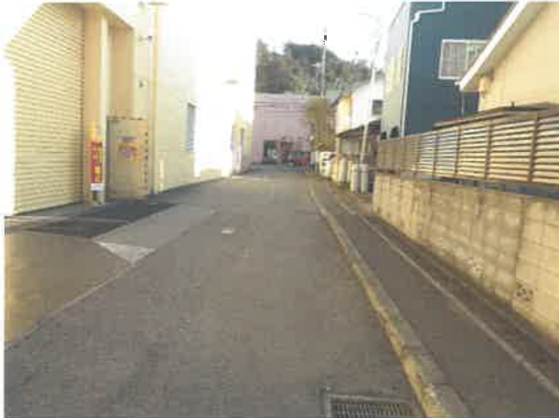
③ 現況写真 (2019年2月18日撮影)