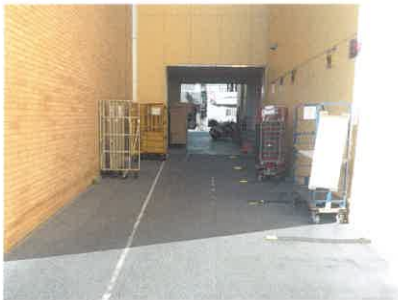
⑨ 現況写真 (2019年2月18日撮影)