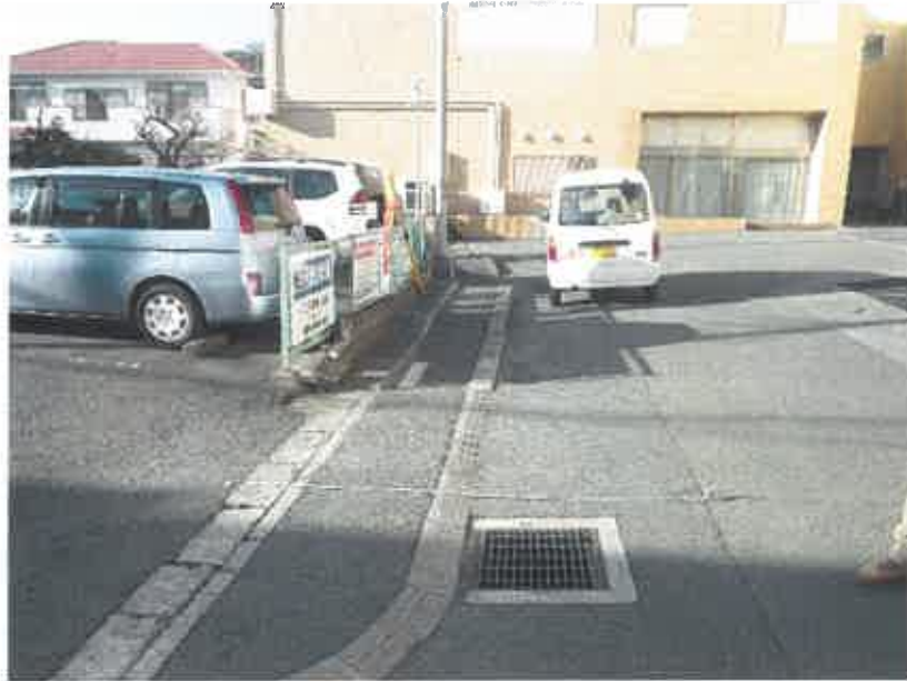
② 現況写真 (2019年2月18日撮影)