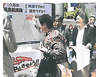
消費税10%中止へ署名&シール投票