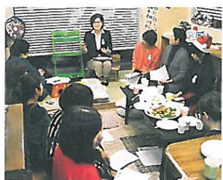
県内各地で子育てママとタウンミーティング