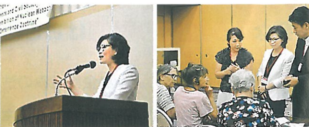
原水爆禁止世界大会・国際会議で発言&外国代表と意見交換