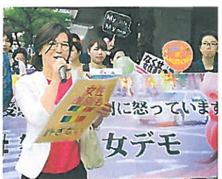
怒りの女デモの先頭に