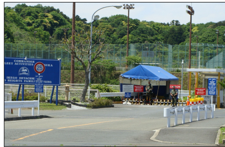
現在の池子ゲート