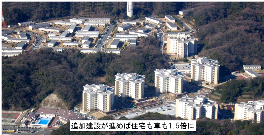
追加建設が進めば住宅も車も1.5倍に

三者合意とは94年に長官・知事・市長が公印を押した正式な公文書です。ところが市長は「合意の順守と追加建設反対」の立場を投げ捨て、容認することを明らかにしました。市長の市民に対する背信行為を許すことはできません。