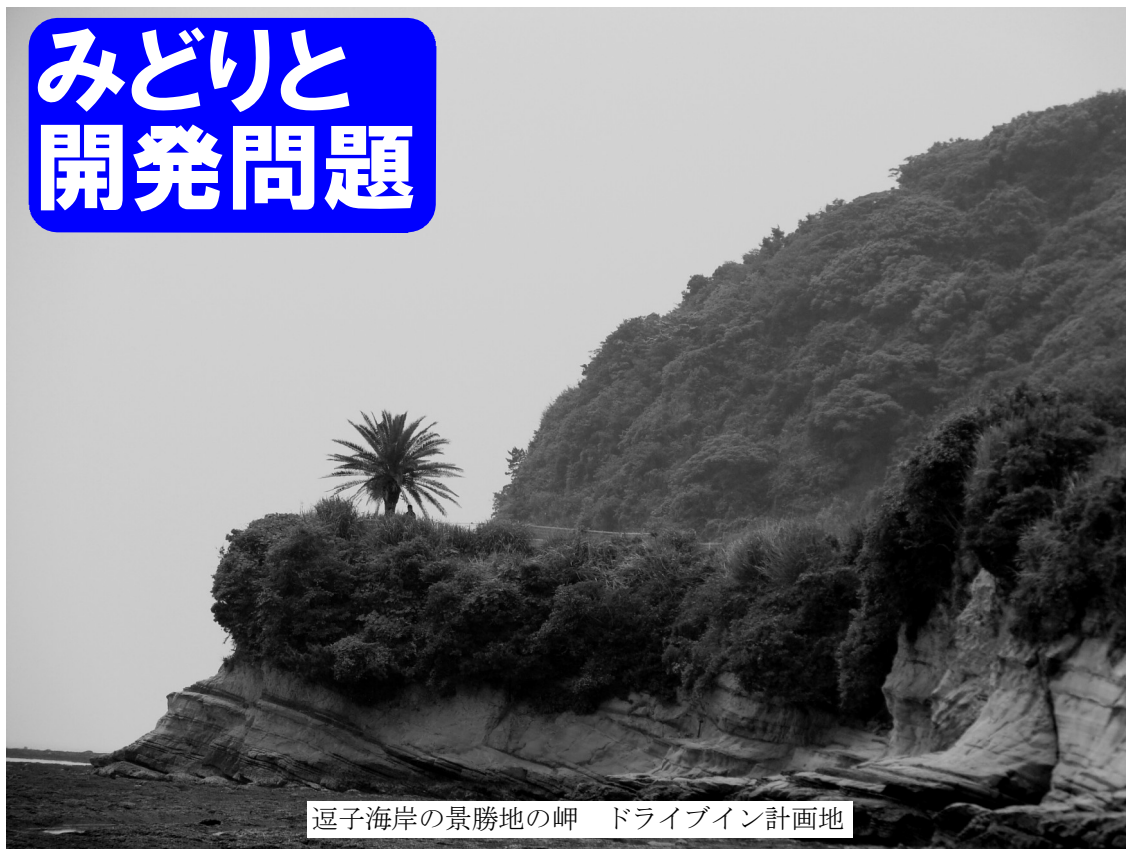
逗子海岸の景勝地の岬 ドライブイン計画地