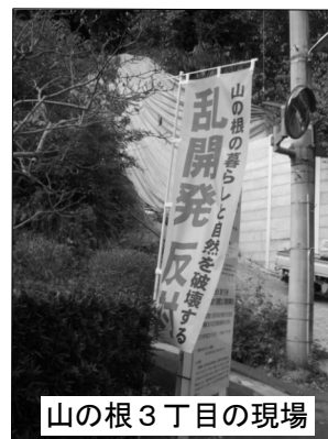
山の根3丁目の現場

条例手続きをせずに建築行為が進んでいます。近隣住民からも陳情が提出され、議会も県と市長に対応を強く求めます。