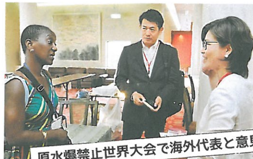
原水爆禁止世界大会で海外代表と意見交換