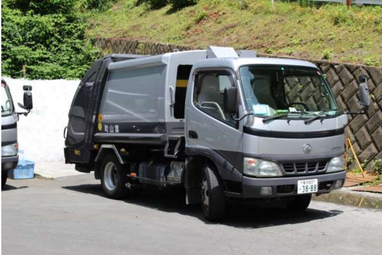
葉山町 ごみ収集車