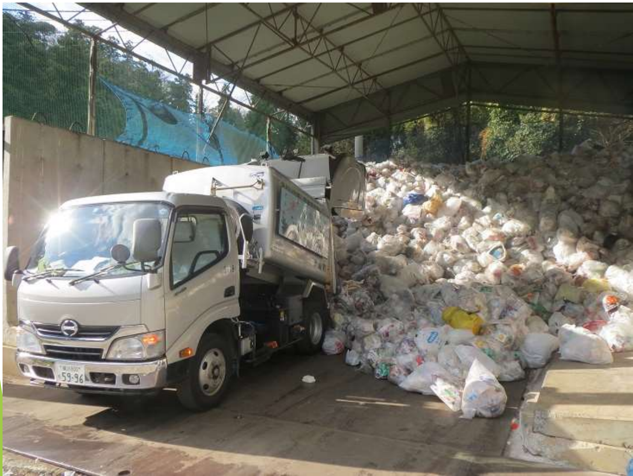
容器包装プラスチックストックヤード