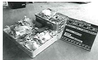
燃やせるごみに入っていた プラスチック製容器包装

また、「雑誌・ざつがみ」については、久喜宮代清掃センター及び八甫清掃センターで混入割合が増加しています。「雑誌・ざつがみ」については3清掃センターとも異物の中で大きな割合を占めています。「プラスチック製容器包装」や「雑誌・ざつがみ」などは資源として回収してリサイクルしています。引き続き、分別の徹底にご協力をお願いします。