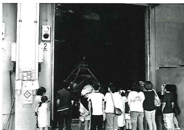
昨年度の3Rでゴミを減らそう講座の様子

※3Rとは、リデュース（なるべくゴミを出さない）、リユース（くりかえし使う）、リサイクル（再び資源として使う）の頭文字です。限りある資源を大切に、ゴミの環境への悪影響を減らすキーワードです。