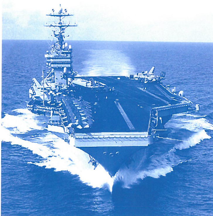
【原子炉2基を積む米原子力空母=東京湾に浮かぶ原発】

2008年9月、米原子力空母ジョージ・ワシントンが事実上の「母港」として横須賀に配備されました。昨年10月、米原子力空母ロナルド・レーガンが交代配備されました。日米両政府は、横須賀を米空母の出撃基地として恒久的に使おうとしています。安倍内閣は「戦争する国」にするために戦争法を強行し、さらに憲法の明文改憲も狙っています。「戦争する国」の法的枠組みが戦争法（憲法改悪）で、横須賀への米原子力空母配備や辺野古への新基地建設などは、その軍事的基盤です。両者は一体のものであります。