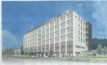
座間総合病院完成予想図 (JMA提供)