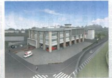
新消防庁舎完成予想図 (平成28年秋着手予定)