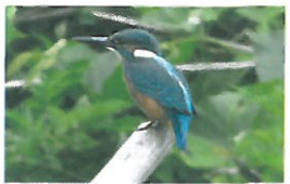
青い宝石と呼ばれる事もあがるカワセミ