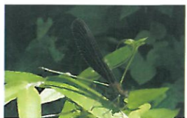
個体数が減少傾向にあるとされるハグロトンボ