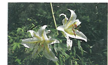
県の花ヤマユリは7月頃に見られます。