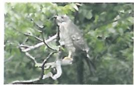
「キンミー」と鳴く渡り鳥のサンバ