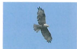
「ピーヨー」「ピーエー」と鳴くノスリ