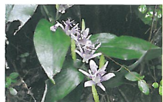
市の花ホトトギスは9~10月頃に見られます。